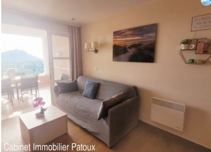
Cabinet Immobilier Patoux