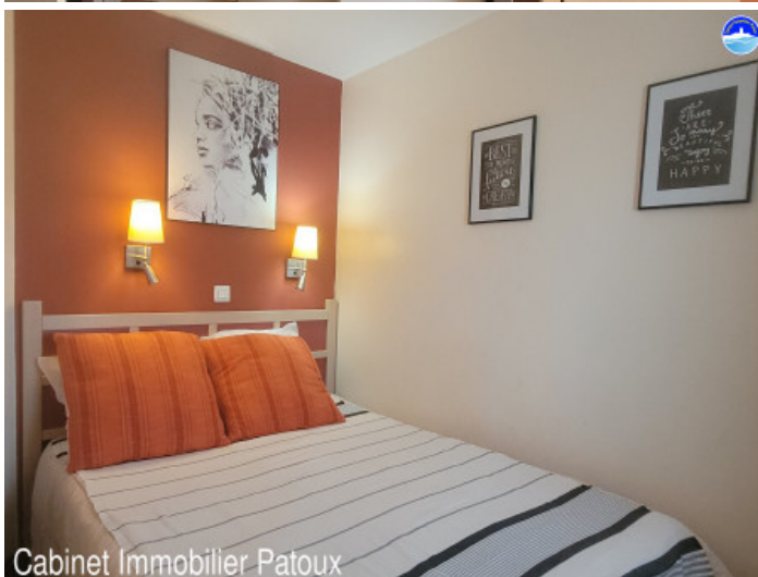
Cabinet Immobilier Patoux