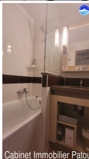
Cabinet Immobilier Patou