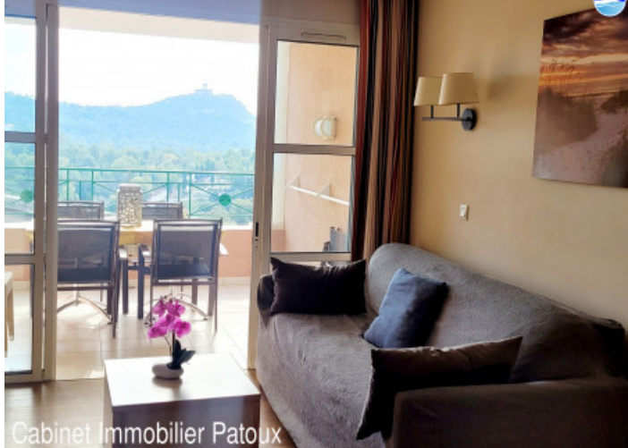
Cabinet Immobilier Patoux