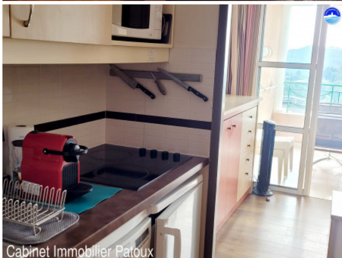
Cabinet Immobilier Patoux