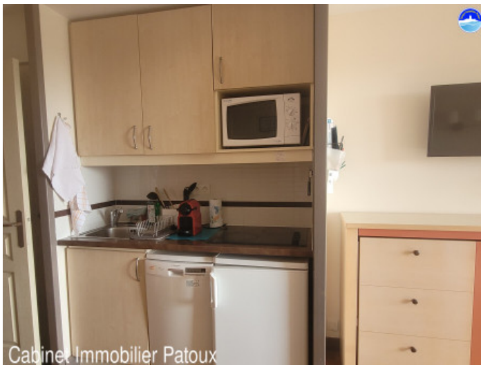
Cabinet Immobilier Patoux