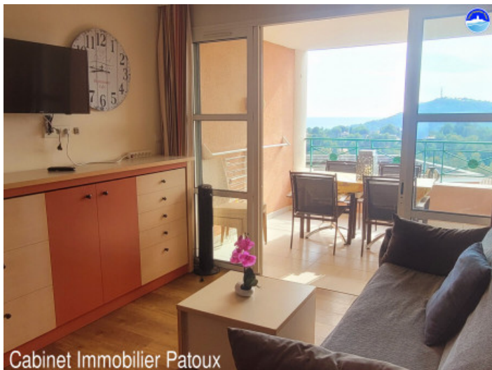
Cabinet Immobilier Patoux