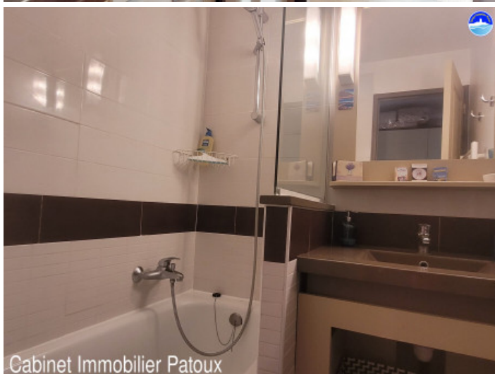
Cabinet Immobilier Patoux